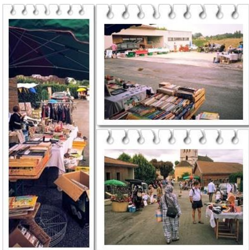
← Vide-grenier organisé le 28 août 2016

Quelques photos pour illustrer les manifestations organisées par l'association Chalagnac Loisirs au cours du 2 ème semestre 2016